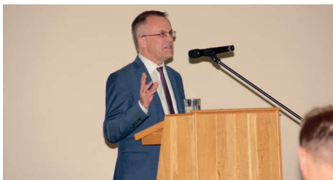
DRUGI PANEL DYSKUSYJNY ROZPOCZĄŁ MINISTER JAROSŁAW SELLIN