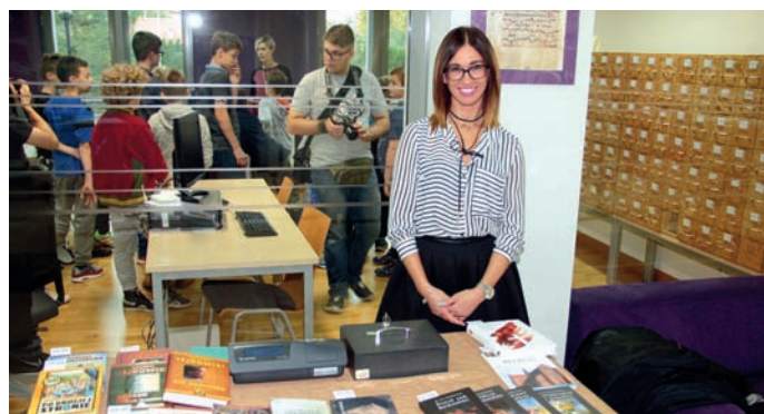
STOISKO WYDAWNICTWA „BERNARDINUM”