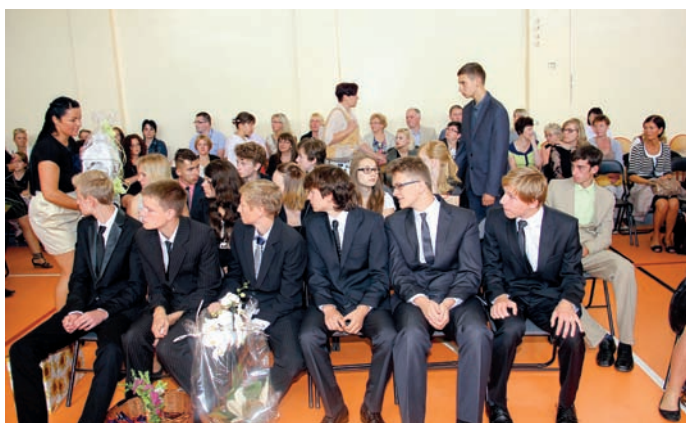
Klasa III b