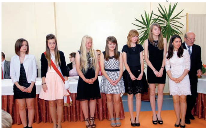
Najlepsi uczniowie klasy III a