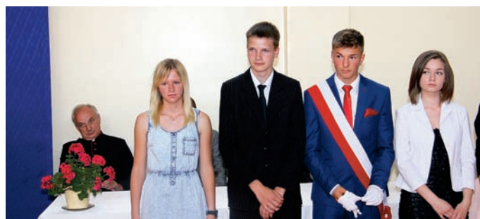
Najlepsi uczniowie klasy III b