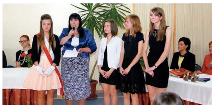
Uczennice współpracujące na co dzień z Radiem „Głos”