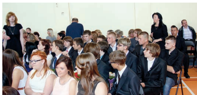
Klasa III c