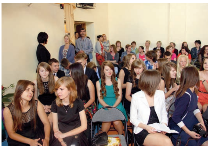
Klasa III a